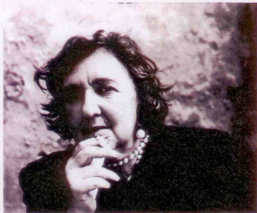
Alda Merini (Milano, 21 marzo 1931 – Milano, 1° novembre 2009)

"Forse è l'angoscia che mi fa cantare; come uccello ferito che decade dall'altissimo ramo e bagna l'ale dentro il tuo ruscello, così son io che giaccio nella terra avvinghiata da morse di dolore."